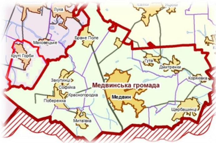
Рисунок 7. Ілюстрація об'єднання громад відповідно до варіанту 4

Приклад: Громада села Круті Горби, як центру сільської ради, виявила бажання приєднатися до сусідньої проектної Медвинської ОТГ, утворення якої планується відповідно до затвердженого КМУ перспективного плану. Оскільки, на думку його жителів, село знаходиться територіально ближче до центру проектної Медвинської ОТГ, інфраструктура проектної ОТГ є більш розвиненішою, село Медвин має свою дільничну лікарню, два дитячих садочки, велику модернізовану загальноосвітню школу та має кращі перспективи для розвитку (рис. 7).