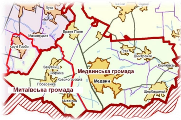
Рисунок 7. Ілюстрація об'єднання громад відповідно до варіанту 5

Приклад: Громада села Митаїв, як центру сільської ради, виявила бажання ініціювати об'єднання територіальних громад у Митаївську ОТГ з центром у селі Митаїв. До цього села виявили бажання приєднатися дві сільські ради, які згідно до перспективного плану повинні входити та як і сама Митаївська сільська рада - до Медвинської ОТГ та одна сільська рада, яка повинна входити до проектної Таращанської ОТГ (рис. 7).