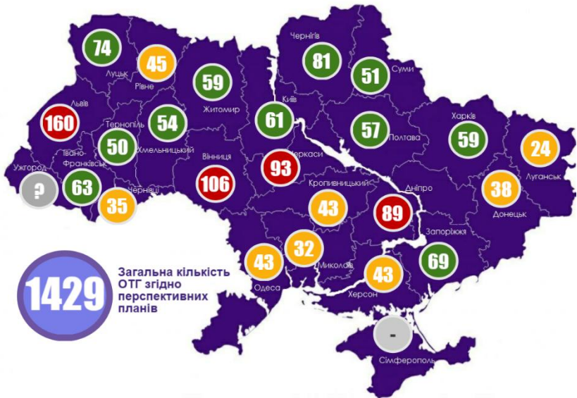
Рисунок 2. Об'єднані територіальні громади по областях України, згідно Перспективних планів формування територій громад областей України (2015)

Найменша кількість ОТГ запропоновано утворити у Луганській області (не враховуючи тимчасово окуповані території) – 24 ОТГ. Найбільшу кількість ОТГ запропоновано утворити у Львівській області – 160. Різниця між областями становить 6,5 разів. Середня кількість ОТГ по областям становить 60.