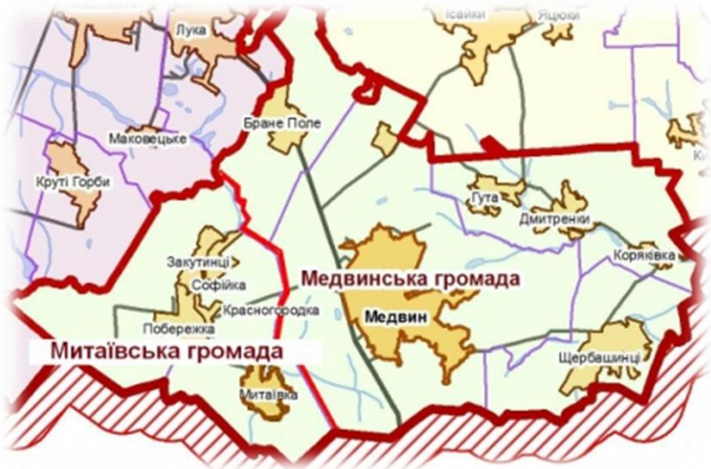
Рисунок 6. Ілюстрація об'єднання громад відповідно до варіанту 3

Приклад: Громада села Митаїв, як центру сільської ради, виявила бажання ініціювати об'єднання територіальних громад у Митаївську ОТГ з центром у селі Митаїв. За процедурою, передбаченою у Законі, звернувшись до усіх суміжних територіальних громад, та громад які суміжні з ними. Проте, оскільки у сусідньому селі Медвин, згідно затверджено КМУ перспективного плану планується центр Медвинської ОТГ, лише одна сусідня сільська рада погодилась об'єднатися із Митаївською сільською радою та утворити Митівську ОТГ з центром у селі Митаїв (рис. 6).