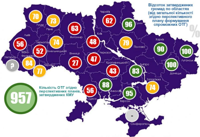
Рисунк 3. Відсоток об'єднаних територіальних громад по областях України, які затвердив КМУ згідно до запропонованих перспективних планів формування територій громад областей України (2015)