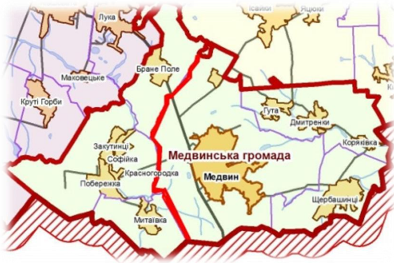
Рисунком 5. Ілюстрація об'єднання громад відповідно до варіанту 2

Приклад: Медвинська ОТГ, затверджена як спроможна, згідно рішення КМУ №1206-р «Про затвердження перспективного плану формування територій громад у Київській області». Згідно до перспективного плану Медвинська сільська рада повинна об'єднатися із 5 сільськими радами та утворити Медвинську ОТГ із центром у селі Медвин. Однак, відповідно до рішень громадських обговорень, дві сільські ради відмовились добровільно об'єднуватися із Медвинською сільською радою та іншими сільськими радами, об'єднання яких планувалось згідно до перспективного плану. Враховуючи це, інші 4 сільські ради об'єдналися без цих сільських рад у сільську ОТГ з центром у селі Медвин.