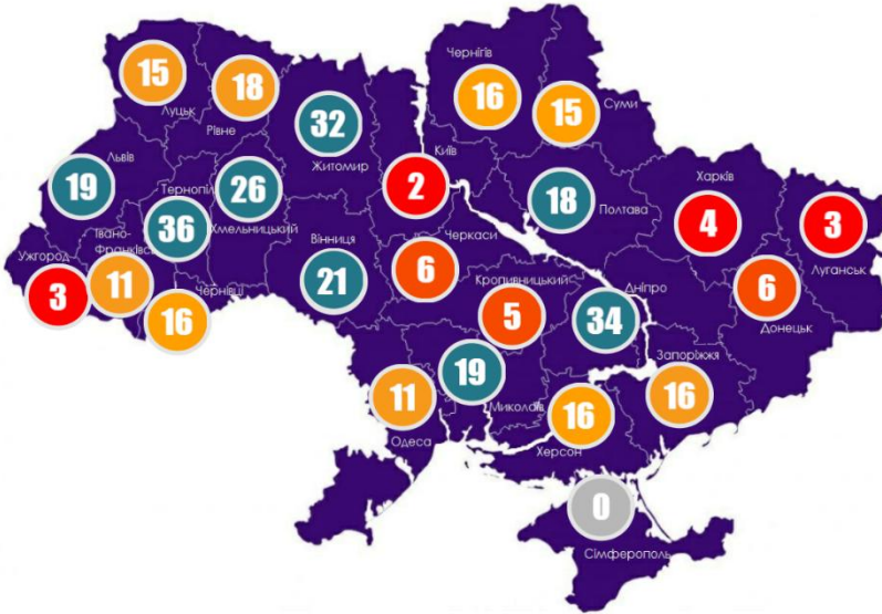
Рисунк 1. Об'єднані територіальні громади України (станом на 01.01.2017 р.)

За власними підрахунками, згідно даних Мінрегіону [4], в Україні вже на початок 2017 року до складу новоутворених ОТГ увійде близько 15% від загальної кількості органів місцевого самоврядування місцевого рівня (11624)[2] та буде проживати близько 3,1 млн. осіб.