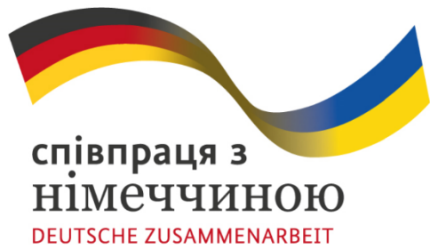
СХЕМА РОЗМІЩЕННЯ ЛОГОТИПІВ:

У процесі додрукарської підготовки всі макети та візуалізації мають бути погоджені із відділом комунікацій DRC: anna.popsui@drc.ngo , olha.sydorova@drc.ngo , Volodymyr.malynka@drc.ngo