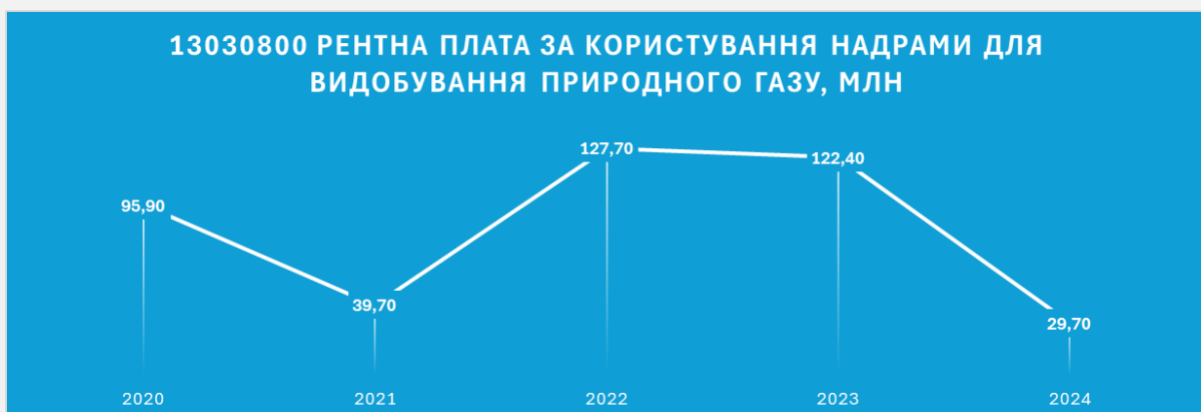
Рис.3. Надходження рентної плати за видобуток природного газу у Великосорочинській громаді Полтавської області

Для прикладу, бюджет Великосорочинської громади Полтавської області, отримував у 2022 і 2023 роках понад 120 млн грн ренти за видобування природного газу, перевищуючи планові показники на понад 43% і 23% відповідно. За 11 місяців 2024, сума ренти склала лише 29 млн грн (45% до уточненого річного розпису), що підтверджує суттєвість та непередбачуваність надходжень.